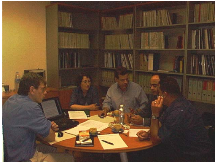
Formation à Barcelone mai-juin 2003