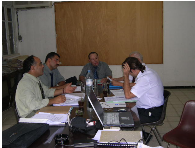
Réunion sectorielle avec l'opérateur du transport urbain STS

Le Comité technique s'est réuni en 7 occasions.