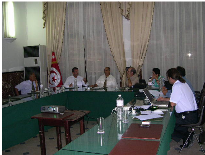
Procès de constitution du Comité de gestion du PDU

Le 18 septembre 2003 se constitue à Sousse le Comité de gestion . En total, il s'est réuni en 5 occasions.